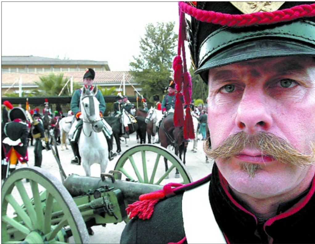
Actores disfrazados de soldados napoleónicos, en la recreación de la batalla de Bailén.